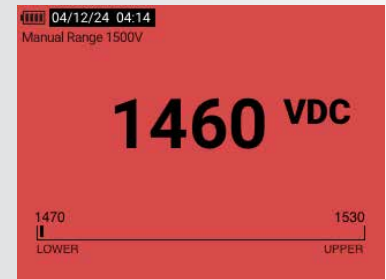
Grenzwertanzeige - außerhalb des Bereichs