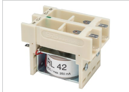
Relais RL 42, bis 6.000 V AC, 2 Wechsler