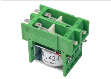
Relais RL 42-I, bis 6.000 V AC, 2 Wechsler, low current