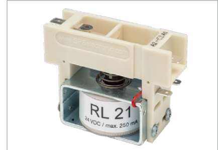
Relais RL 21, bis 6.000 V AC 1 Wechsler