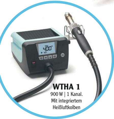
WTHA 1 900 W | 1 Kanal. Mit integriertem Heißluftkolben